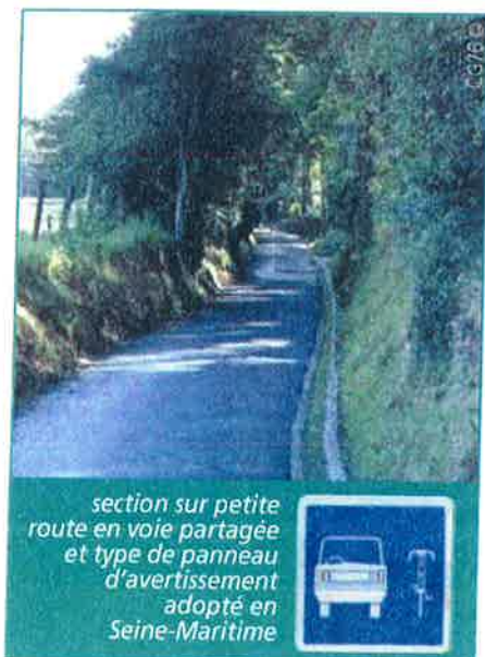
section sur petite route en voie partagée et type de panneau d'avertissement adopté en Seine-Maritime